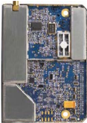
Kompaktowa wielkość (widok wnętrza od góry)