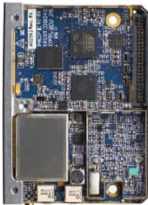
Kompaktowa wielkość (widok wnętrza od dołu)